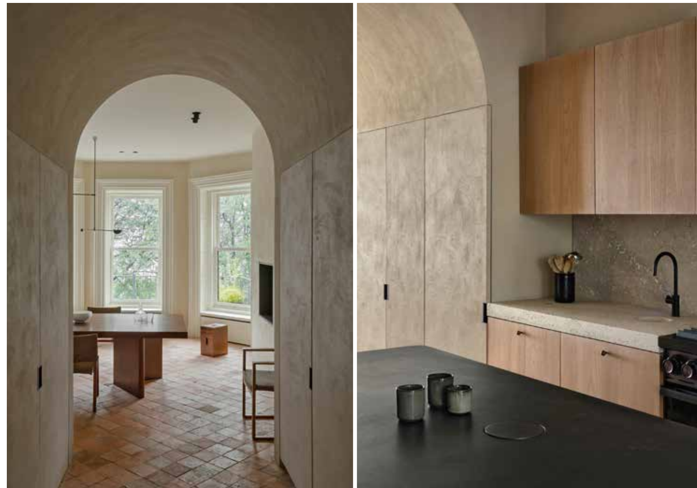
Sopra a sinistra e nella pagina accanto, due scorci della sala da pranzo al primo piano. Credenza italiana del XVIII secolo; tavolo in teak Library table di Pierre Jeanneret (1955); sedie di Børge Mogensen per Lauritsen & Søn; lampada Mobile Chandelier 1 di Michael Anastassiades. A parete, il quadro Lost in the Stars di Volker Hüller (2014). Sopra a destra, la cucina di rovere, travertino e acciaio inox annerito. ● Above left and facing page, two views of the dining room on the first floor. Italian dresser from the 18 th century; teak Library Table by Pierre Jeanneret (1955); chairs by Børge Mogensen for Lauritsen & Søn; Mobile Chandelier 1 by Michael Anastassiades. On the wall, Volker Hüller's painting Lost in the Stars (2014). Above right, the kitchen in oak, travertine and blackened stainless steel.

ca, sala da pranzo e living con il vecchio camino e le originali pannellature lignee; al primo la cucina, un'altra sala da pranzo e la stanza dei giochi per i bambini; al secondo le camere da letto, i due bagni più grandi e lo spogliatoio – il digradare dai marroni intensi della zona giorno ai toni sabbiosi e man mano che si sale sempre più solari, crea una dinamica cromatica che distingue e insieme armonizza. Generando allo stesso tempo interessanti contaminazioni: la 'nuance' scura del pavimento del salone ricorda i mattoni della facciata, le piastrelle in cucina evocano atmosfere provenzali, mentre i legni chiari, i tessuti e i marmi del secondo piano hanno un sapore scandinavo. Infine una domanda prosaica – e la risposta di Schuybroek rassicura: «Sì, l'ascensore c'è». Insomma, nobile semplicità, quieta grandezza, ma anche indispensabile senso pratico.