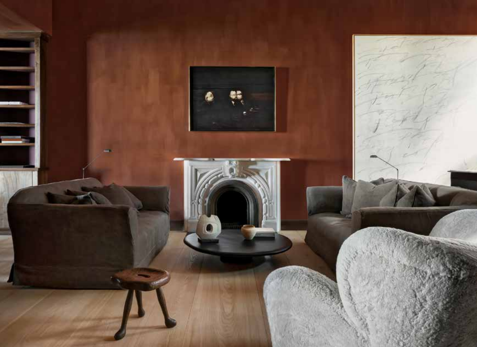
In alto, il living si sviluppa intorno al vecchio camino della townhouse, sopra il quale è esposto il dipinto Three Gentlemen di Ida Barbarigo (1979). Divani vintage; coffee table di Axel Vervoordt; sgabello di quercia vintage. A fianco del camino, l'opera Snow Bird (Tom Brady) di Tyrrell Winston (2021). Nella pagina accanto: in alto, la consolle di pino Utö di Axel Einar Hjorth (1932); a parete, applique di cemento bianco Lipstick di Kalou Dubus, quadro Two figures di Ida Barbarigo (1979); in basso, l'arco attraverso il quale si accede alla sala da pranzo del piano terreno. In apertura, nella sala da pranzo al piano terreno un'opera di Callum Innes del 1997. Tavolo di antiquariato e sedie con rivestimento di lino. ● Above, the living room centres on the townhouse's old fireplace, above which hangs the painting Three Gentlemen by Ida Barbarigo (1979). Vintage sofas; coffee table by Axel Vervoordt; vintage oak stool. Next to the fireplace, Tyrrell Winston's work Snow Bird (Tom Brady) (2021). Facing page: top, Axel Einar Hjorth's pinewood Utö console table (1932); on the wall, Kalou Dubus's white concrete Lipstick sconce, Ida Barbarigo's picture Two Figures (1979); below, the arch which provides access to the dining room on the ground floor. At the beginning, a work by Callum Innes from 1997 in the dining room on the ground floor. Antique table and chairs upholstered in linen.