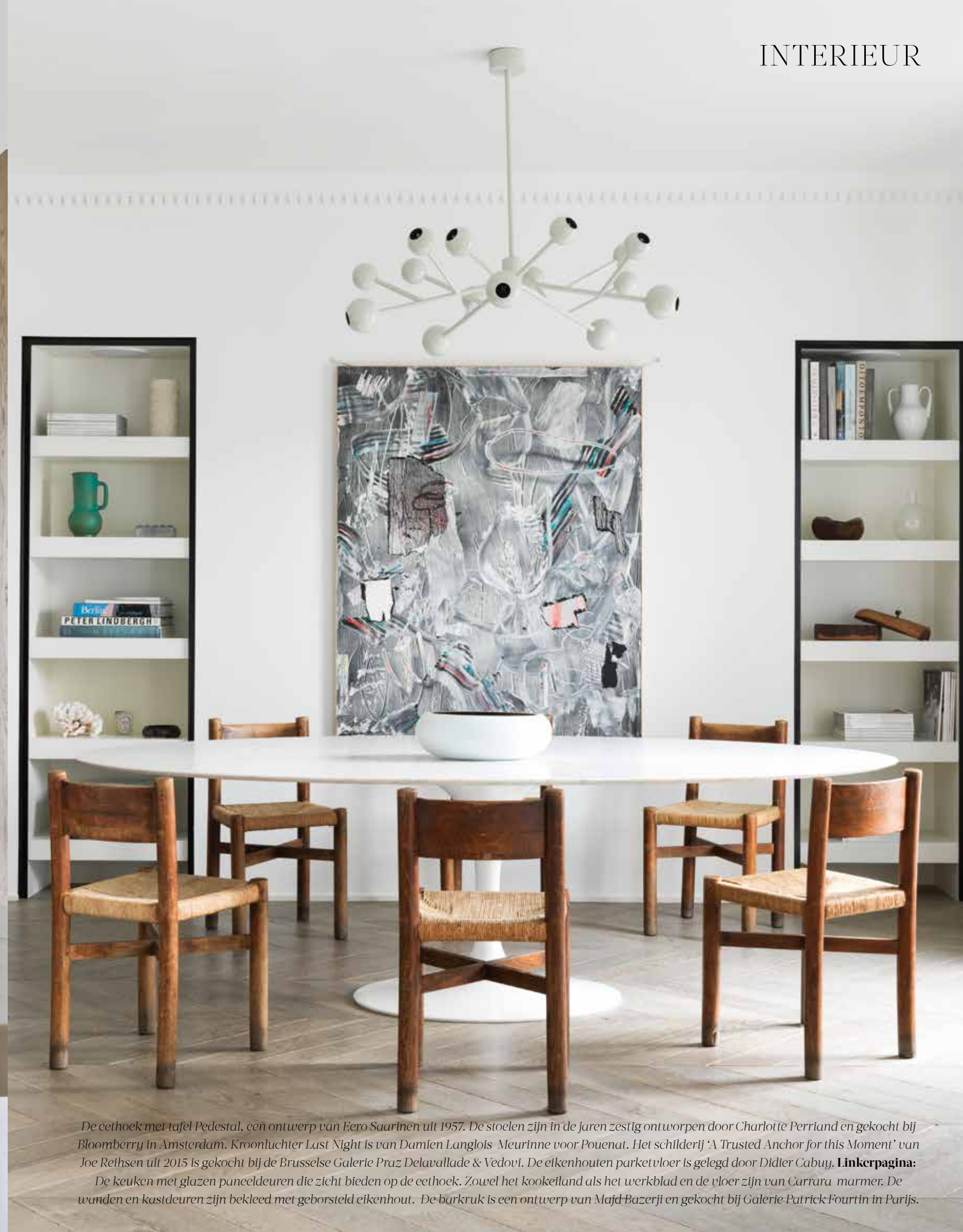
De eethoek met tafel Pedestal, een ontwerp van Eero Saarinen uit 1957. De stoelen zijn in de jaren zestig ontworpen door Charlotte Perriand en gekocht bij Bloomberry in Amsterdam. Kroonluchter Last Night is van Damien Langlois Meurinne voor Pouenat. Het schilderij 'A Trusted Anchor for this Moment' van Joe Reihsen uit 2015 is gekocht bij de Brusselse Galerie Praz Delavallade & Vedovi. De eikenhouten parketvloer is gelegd door Didier Cabuy. Linkerpagina: De keuken met glazen paneeldeuren die zicht bieden op de eethoek. Zowel het kookeiland als het werkblad en de vloer zijn van Carrara marmer. De wanden en kastdeuren zijn bekleed met geborsteld eikenhout. De barkruk is een ontwerp van Majd Bazerji en gekocht bij Galerie Patrick Fourtin in Parijs.