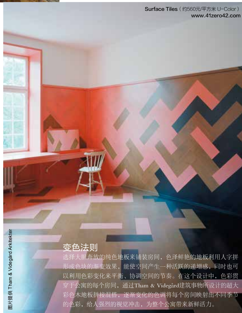
Surface Tiles (约560元/平方米 U-Color) www.41zero42.com